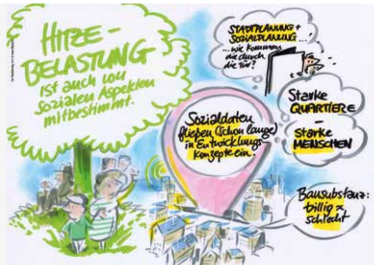
live Visualisierung