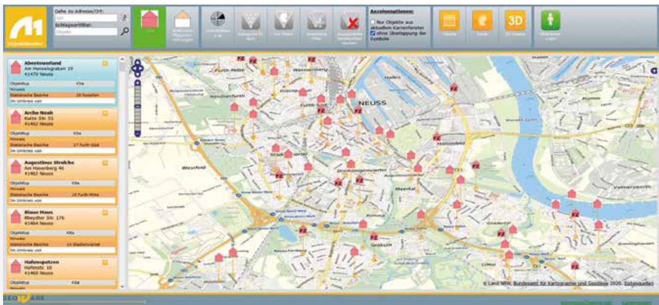
Sozialatlas Stadt Neuss – KITAS in der Kartenansicht

auch, Daten grafisch aufzubereiten und visuell, flächenbezogen in Kartenform über das gesamte Stadtgebiet darzustellen. Dies geschieht im „Sozialatlas“, in einer webbasierten Plattform, die sowohl eine tabellarische als auch eine georeferenzierte Darstellungsform ermöglicht.