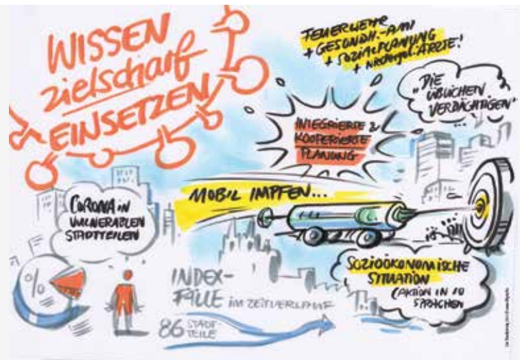
live Visualisierung

Strategische Planung und Sozialraum- koordinator*innen als Scharnier zwischen Verwaltung und Sozialraum