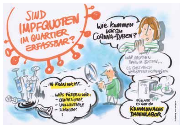
live Visualisierung

Und noch etwas ist der Stabsstelle durch die Impfkationen deutlich geworden: Es benötigt neben den Aktionen auch eine Überzeugungsarbeit und besondere Ansprache der Zielgruppen in den Sozialraumgebieten zum Thema Covid. Durch die Sozialplanung und den Bei-